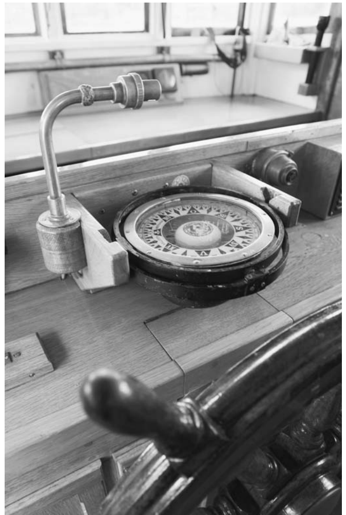
Der originale Kompass