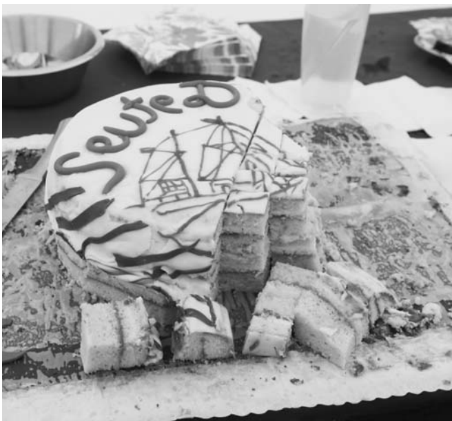
Der Geburtstagskuchen - nur noch ein Wrack