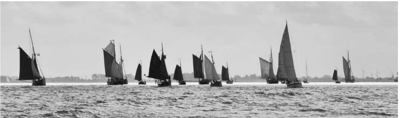
LANDRATH KÜSTER vor dem Feld