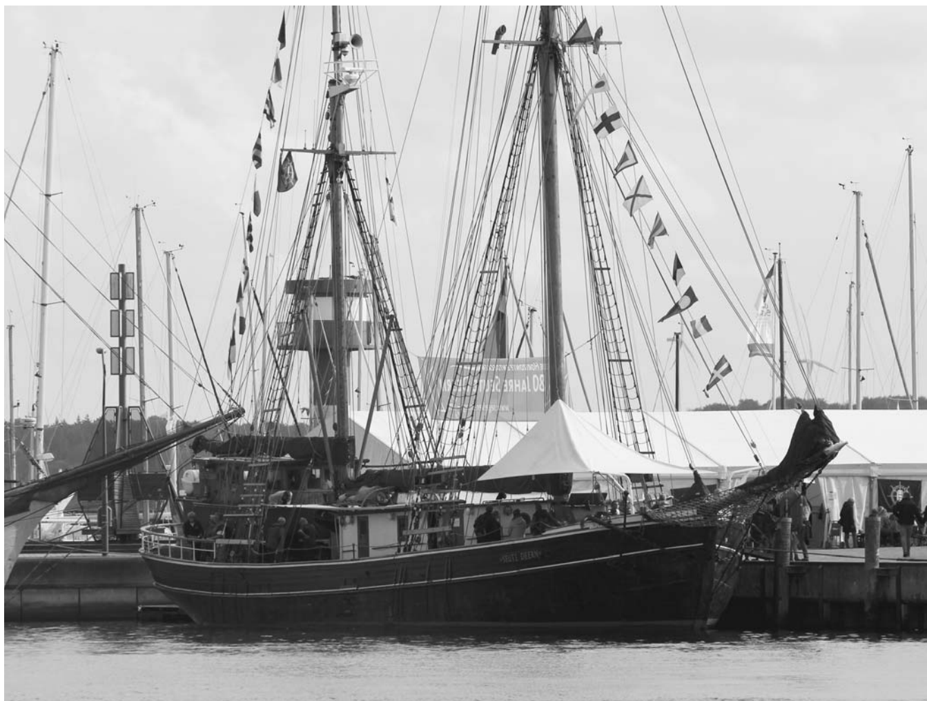
Die SEUTE DEERN an Ihrem Geburtstag

schiffes DEUTSCHLAND auf neue Aufgaben. Die ehemaligen Kadetten liebten trotz, oder vielleicht gerade deswegen, ihr Schiff. Sie schafften es tatsächlich, bei minimaler Erfahrung im Führen großer Segelschiffe, die