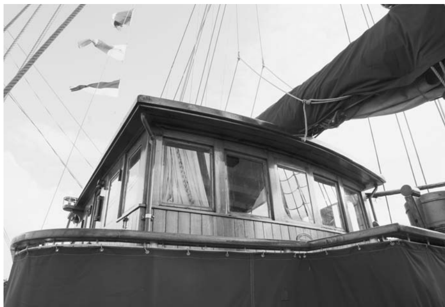
Das Ruderhaus wie früher

Auf bekanntermaßen harten Ausbildungstörns, sie dauerten vier bis sechs Wochen, ließ der NDL 420 Seemannschüler ausbilden, 9.400 sm legte der Schoner bis zum Ende dieser Charter am 23. Dezember 1969 zurück. Da am