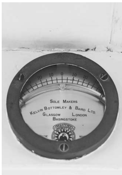
Das alte Clinometer

Auf bekanntermaßen harten Ausbildungstörns, sie dauerten vier bis sechs Wochen, ließ der NDL 420 Seemannschüler ausbilden, 9.400 sm legte der Schoner bis zum Ende dieser Charter am 23. Dezember 1969 zurück. Da am