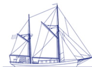
Seute Deern 1939